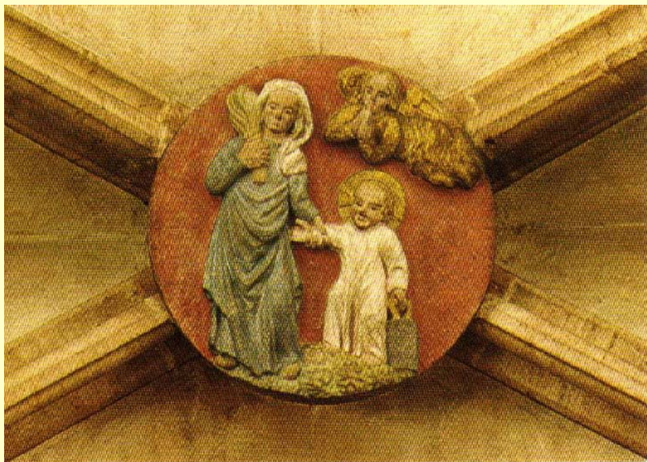
Jesu Schulgang. Schlußstein in der Frauenkirche Nürnberg.

Und alle, die ihm zuhörten, verwunderten sich über seinen Verstand und seine Antworten. (Lukas 2,47)