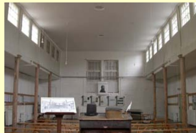
In diesem Klassenraum hat ein (!) Lehrer gleichzeitig Schüler unterrichtet