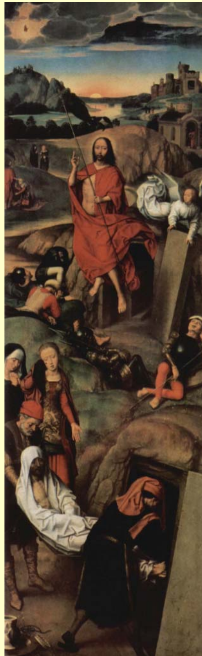
Hans Memling: Auferstehung. Altartriptychon der Lübecker Marienkirche, rechter Flügel.