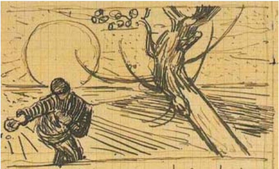
Vincent van Gogh: Sämann mit aufgehender Sonne (aus einem Skizzenbuch)

Gott spricht: Solange die Erde steht, soll nicht aufhören Saat und Ernte, Frost und Hitze, Sommer und Winter, Tag und Nacht. (1. Mose 8,22)