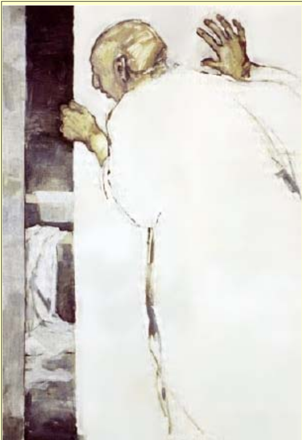
Janet Brooks-Gerloff: Leeres Grab, 1986

von den Toten auferstehen müßte. DA GINGEN DIE JÜNGER WIEDER HEIM.