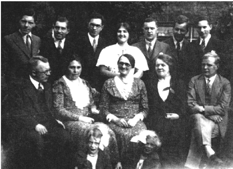
Dietrich Bonhoeffer 1934 bei einem Geburtstagsbesuch in seiner Gemeinde in Forest Hill (ganz rechts vorn).