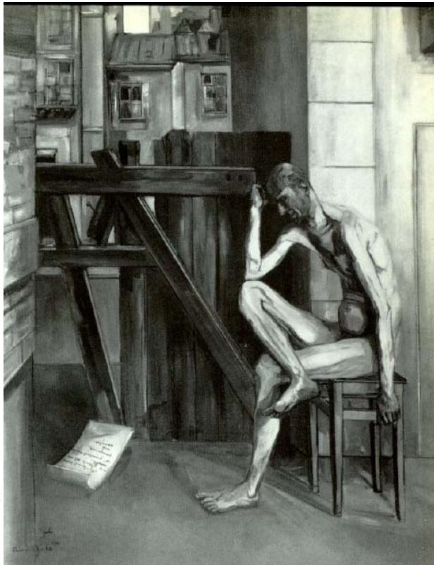
Francis Gruber: Hiob, 1944.

Auch heute lehnt sich meine Klage auf; seine Hand drückt schwer, daß ich seufzen muß. (Hiob 23,2)