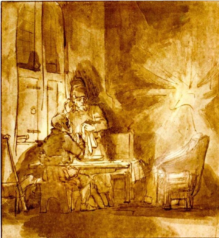
Rembrandt: ...und er verschwand vor ihnen. Um 1648. (Vgl. Lukas 24,30f.).