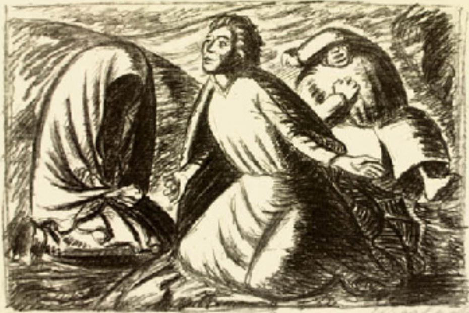
Ernst Barlach: Hoffnung und Verzweiflung 2 (Lithographie, 1934).

Gott gebe euch erleuchtete Augen des Herzens, damit ihr erkennt, zu welcher Hoffnung ihr von ihm berufen seid. (Epheserbrief 1,18)