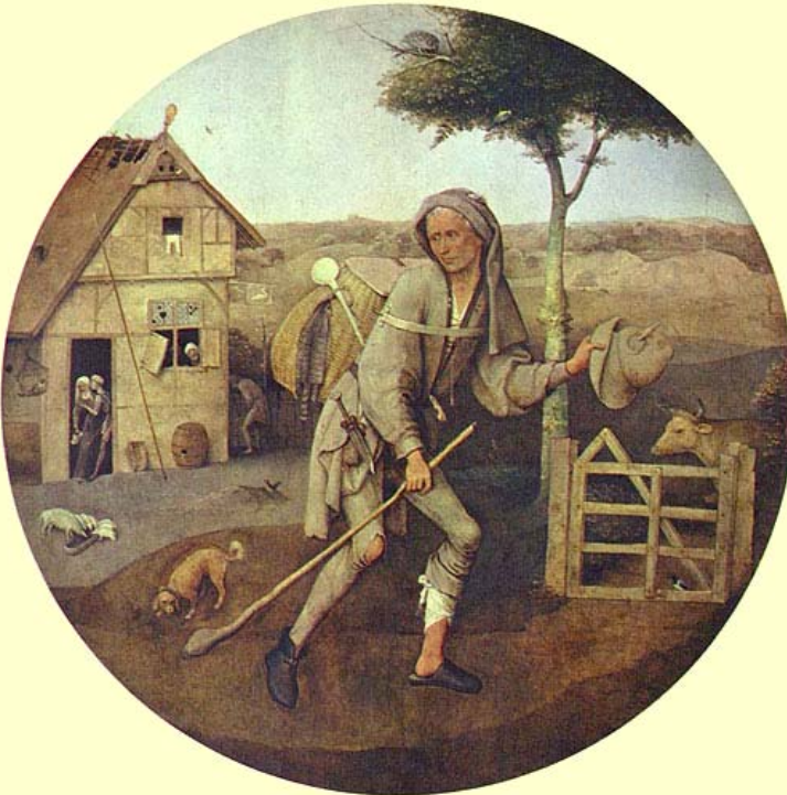
Hieronymus Bosch: Der verlorene Sohn, um 1500.

Ich will mich aufmachen und zu meinem Vater gehen.